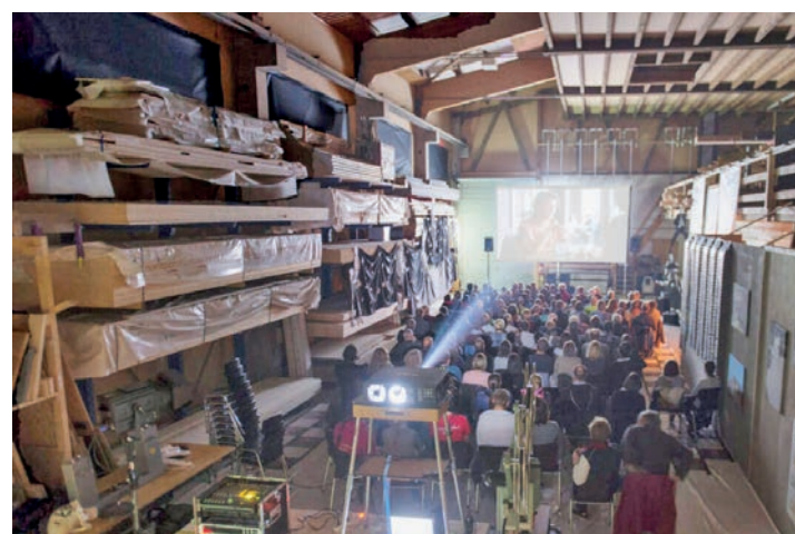
Le ciné-bus itinérant de Roadmovie s'arrête dans des communes qui n'ont pas ou plus de cinéma.

terres genevoises à Choulex le 30 septembre, puis à Satigny le 1er octobre, où le film «Ciao-Ciao Bourbine» de Peter Luisi sera projeté. Des dates sont aussi prévues dans la région, à Perrefitte le jeudi 3 octobre, Grandfontaine le vendredi 4 octobre ou encore à Safnren le mardi 29 octobre. ats-mpr